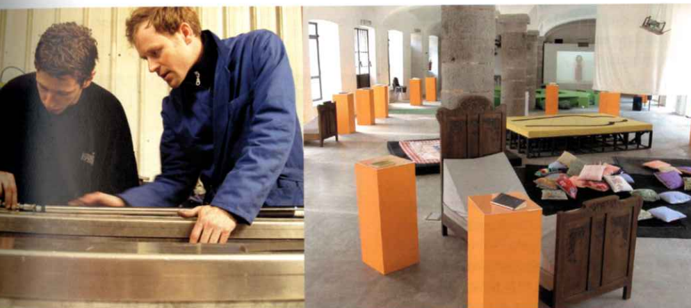
left at Espeel Constructions right at the Cittadellarte (Turning Point Literature - Living Library exhibition, 2004; photo by Marco Scattaro)

De finaliteit van beide organisaties, zowel van Cittadellarte als van Arteconomy, concentreert zich in het moment en de dynamiek van de ontmoeting. Cittadellarte is een open huis voor collectieve samenwerkingen met een heel diverse groep van sociale actoren. Arteconomy is