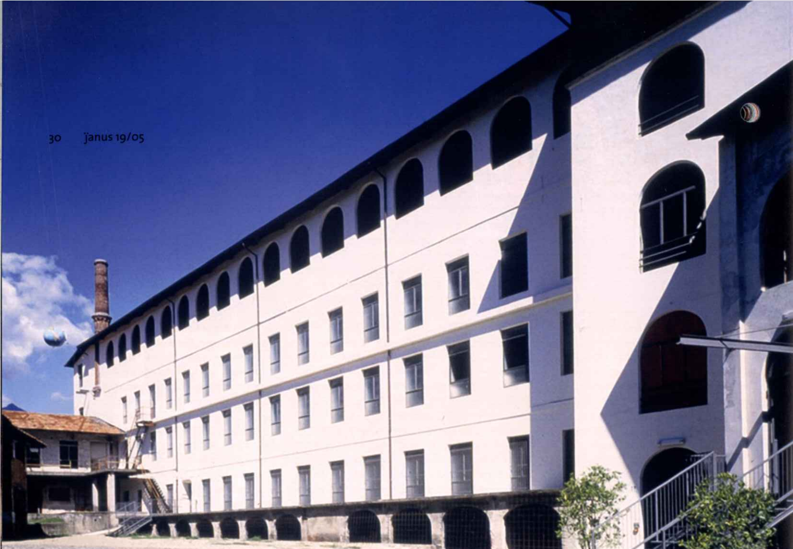
Cittadellarte-Fondazione Pistoletto, Biella

it refers to the current realisation. The coming together of the two points produces the synthesis that embraces the entire sequence of single events analysed by history.