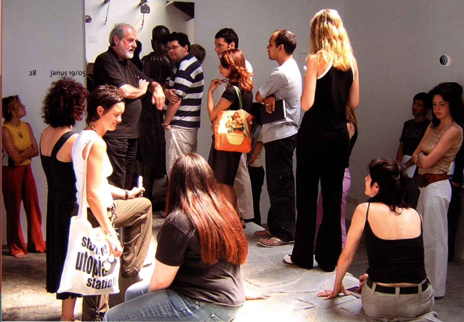
Michelangelo Pistoletto with the participants at UNIDEE in residence 2004

I was asked if it was a utopia: I replied that it was actually a project that originated, clearly, from a utopian moment that nonetheless delineated the plan necessary to achieve the practical realization of the project itself. Utopia is the absence of place, while the project actually leads to a place. At the time I made that presentation, I had already acquired most of the buildings that were to become Cittadellarte. The whole thing is thus bound up in a consequential relationship. In fact, the work that developed in this space is non-utopian.